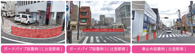
ガードパイプ設置例①[辻堂駅南]